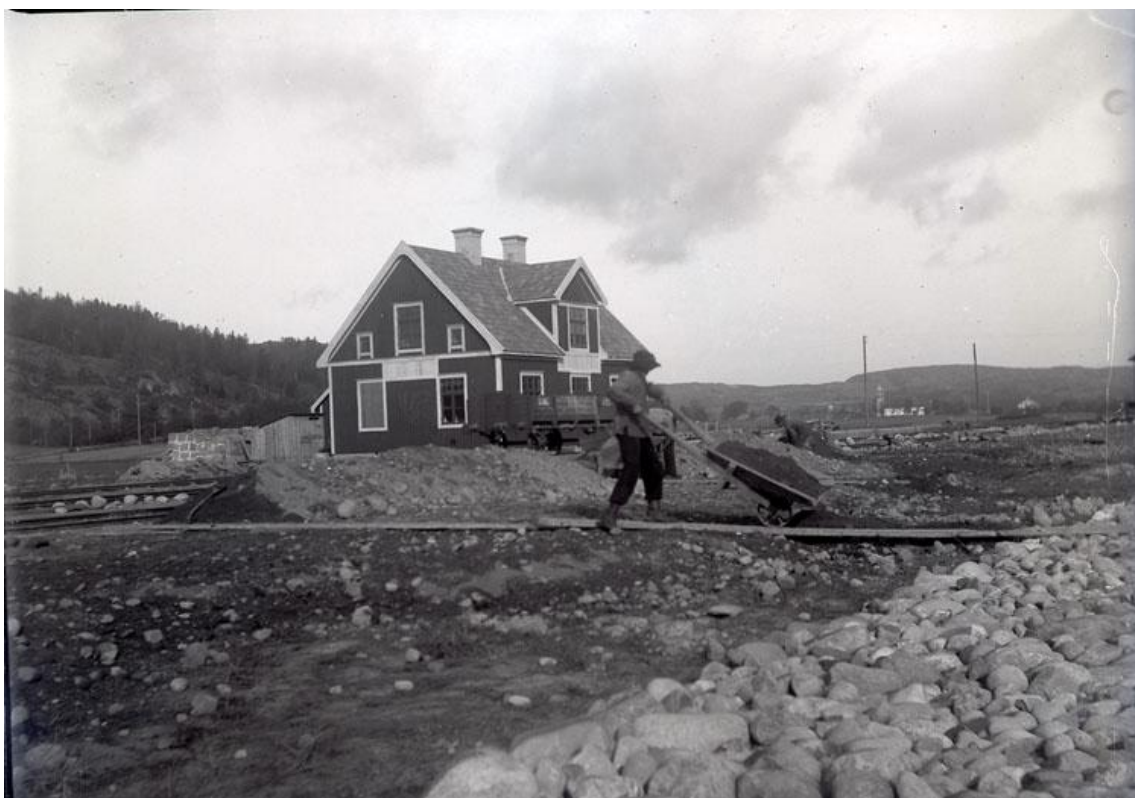
1912-10-.. Brodalen, Stationshuset.

smedjan i Stångehuvud. Han bötade härför 10 kronor. (Nya Lysekils-Kuriren, 1912-10-16/KJ)