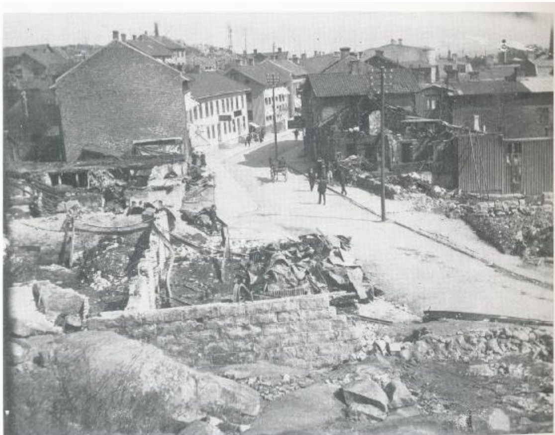
Efter branden 1912. Brandmuren t.v. på nuvarande nr 19 Kungsgatan stoppade eldens framfart. Då hade fem byggnader härjats av eld.